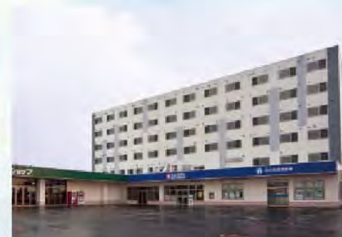
アシステッド・ハウス沼ノ端