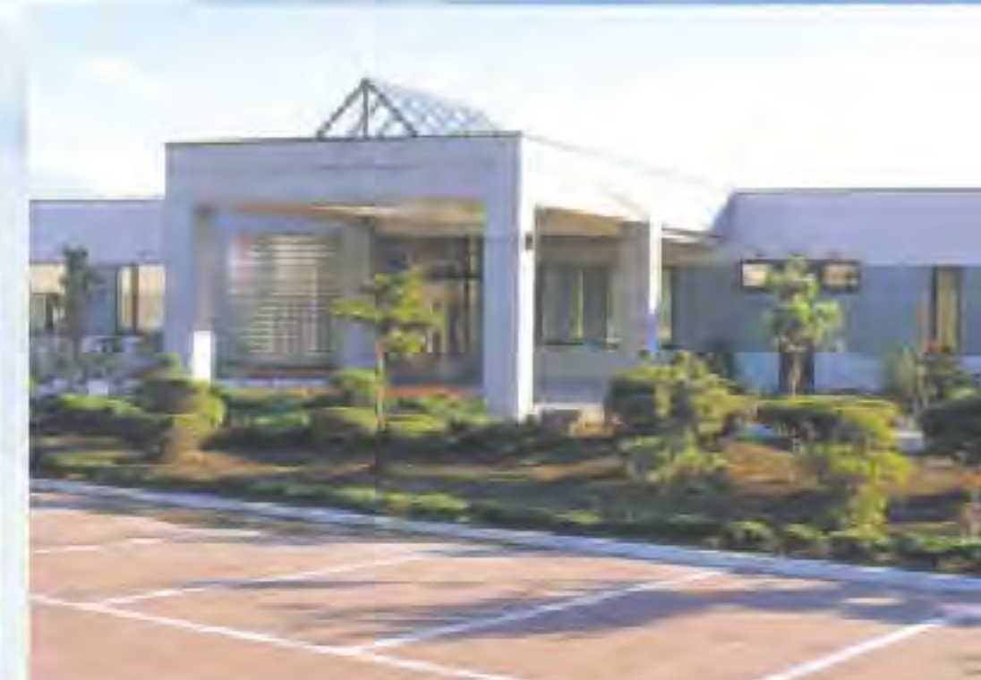
介護老人保健施設 プライムヘルシータウン湘南