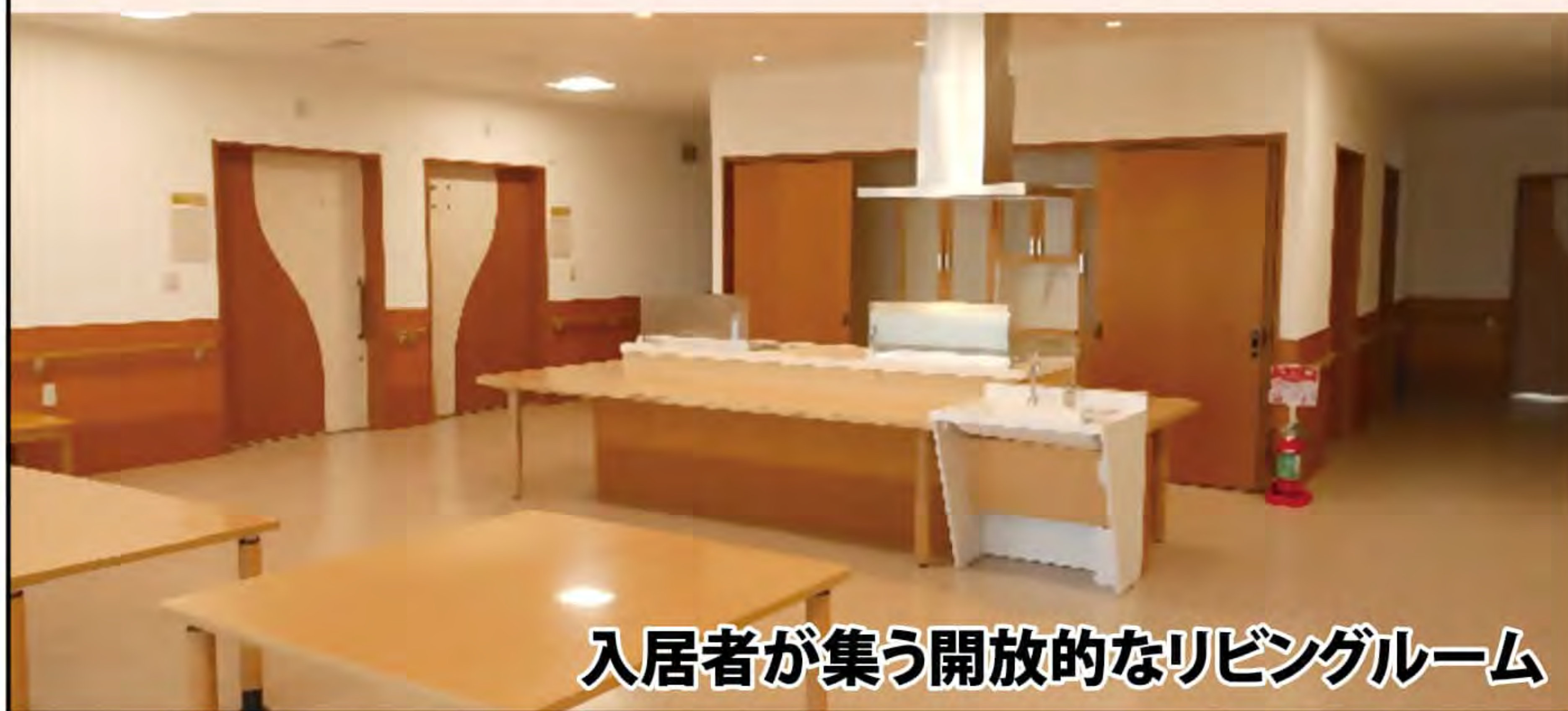
入居者が集う開放的なリビングルーム