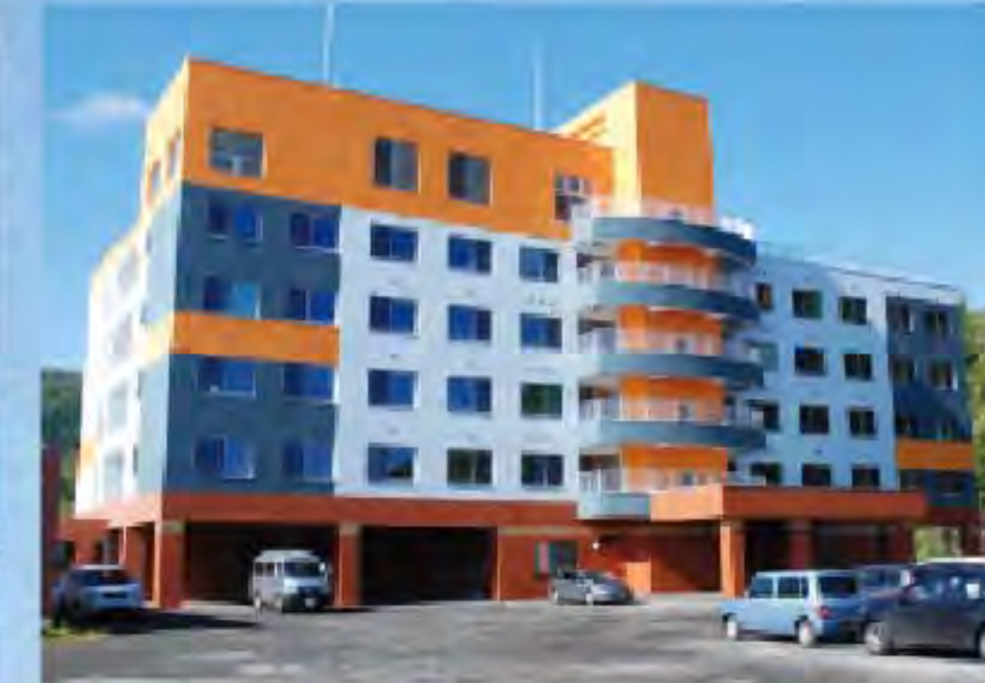
特別介護老人ホーム幸豊園