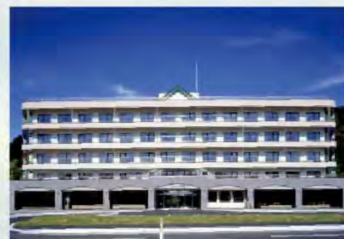
ケアハウス クアリゾート453