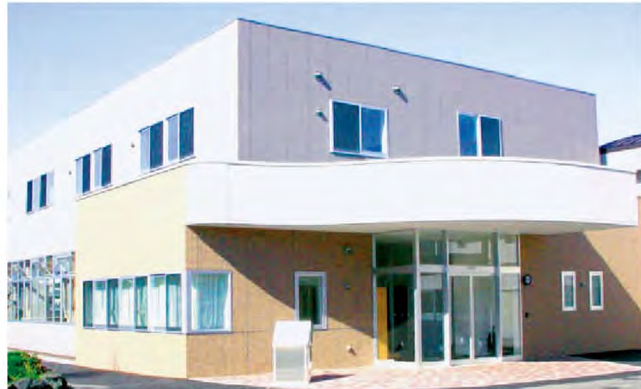
医療福祉施設「けいあい」「ゆうあい」

登別市地域包括支援センター「けいあい」…TEL(0143)82-5005 指定居宅介護支援事業所「けいあい」…TEL(0143)86-8500 精神科デイケア施設「ゆうあい」…TEL(0143)86-0666 通所リハビリテーション「ふれあい」…TEL(0143)82-2200 認知症疾患医療センター…TEL(0143)87-0100 訪問看護ステーション「あい」…TEL(0143)86-1086