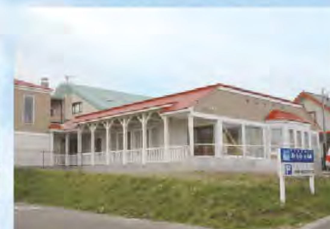
リビングホームみたらの杜