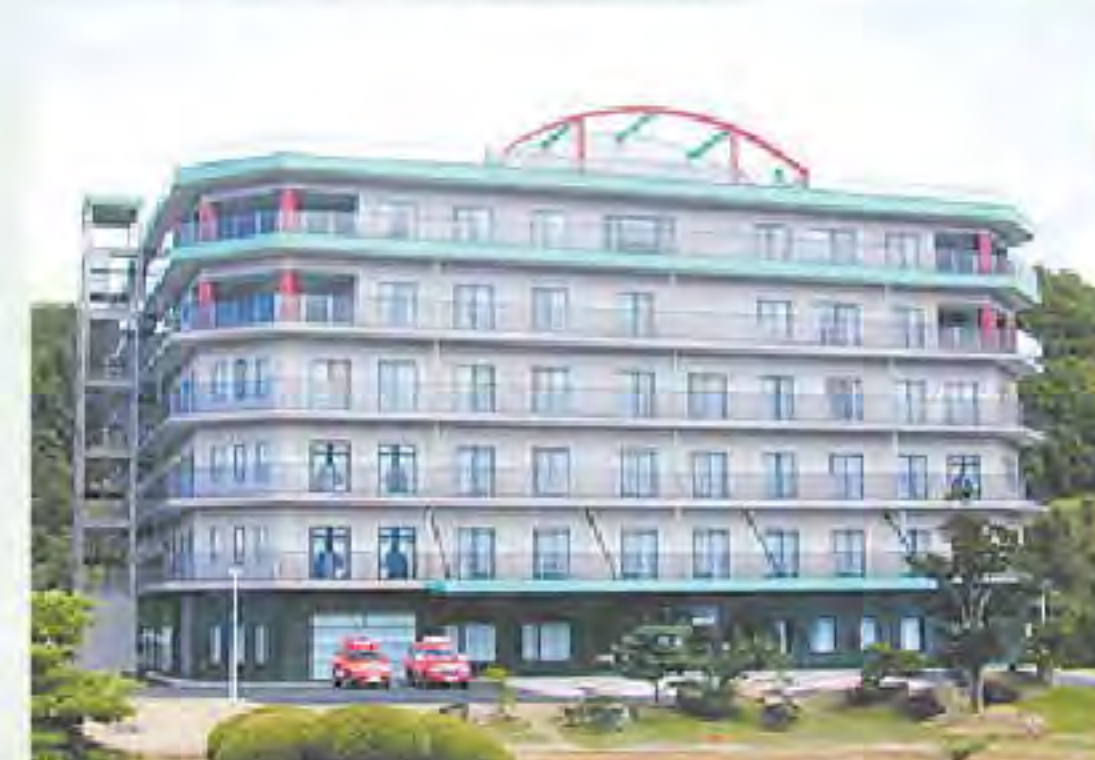
ふるりの丘総合福祉館

穏やかで、楽しい、尊厳ある生活を保障する。 その人らしいあたりまえの生活を保障する。