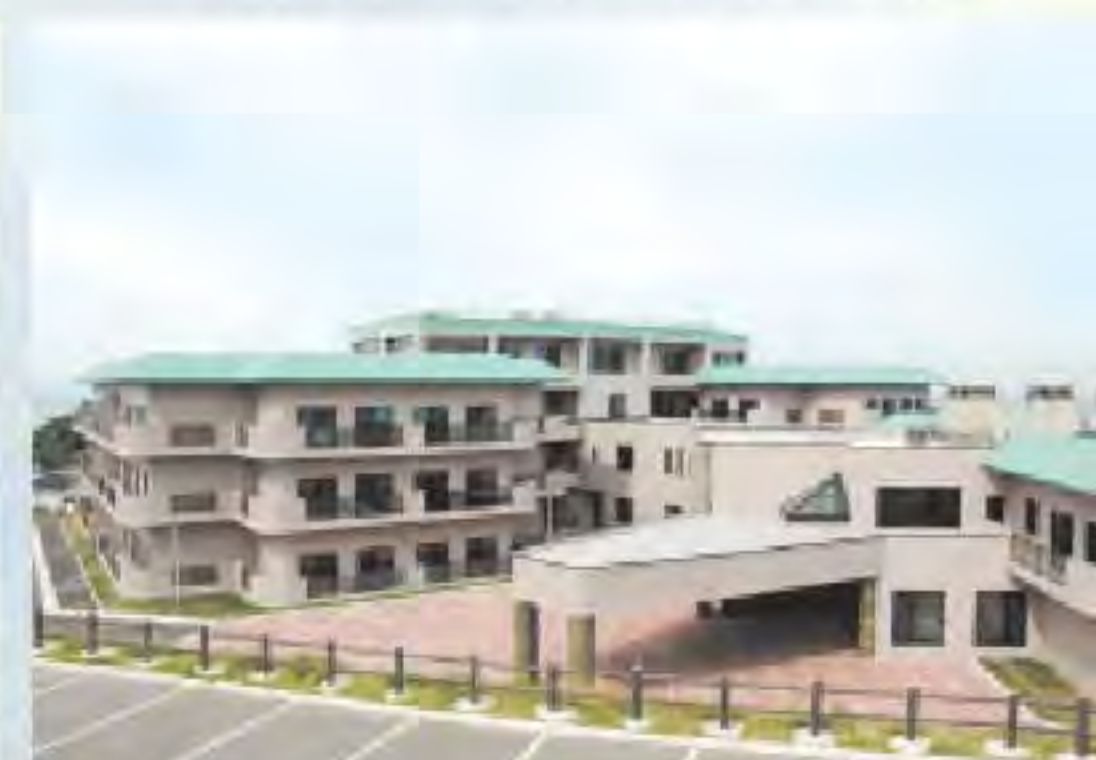
特別介護老人ホームみたらの杜