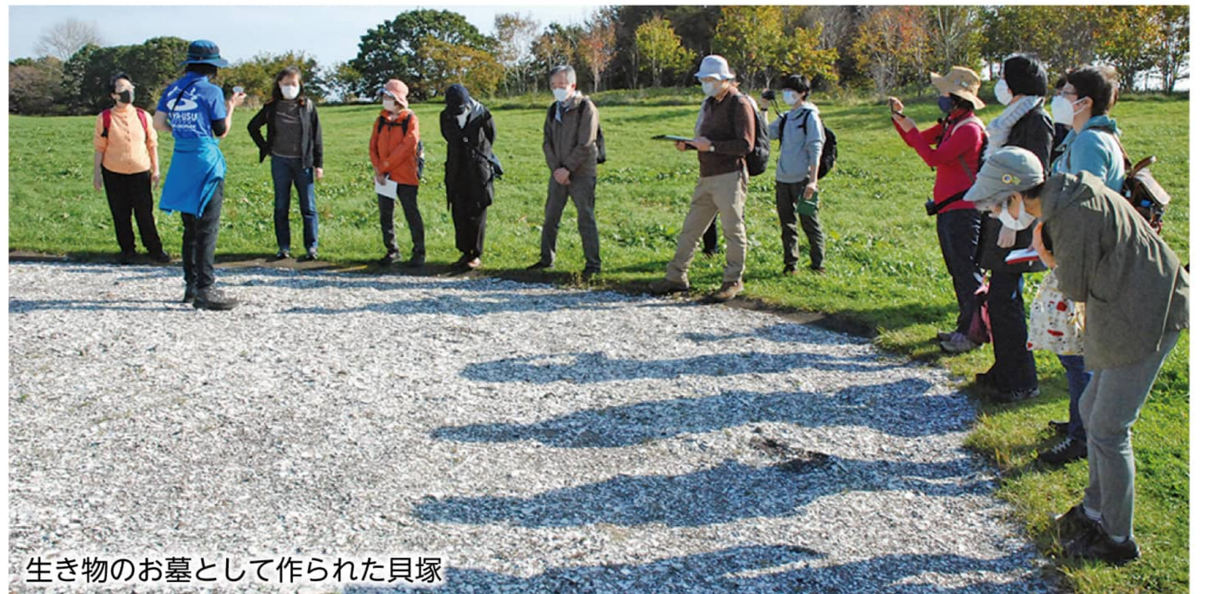
生き物のお墓として作られた貝塚