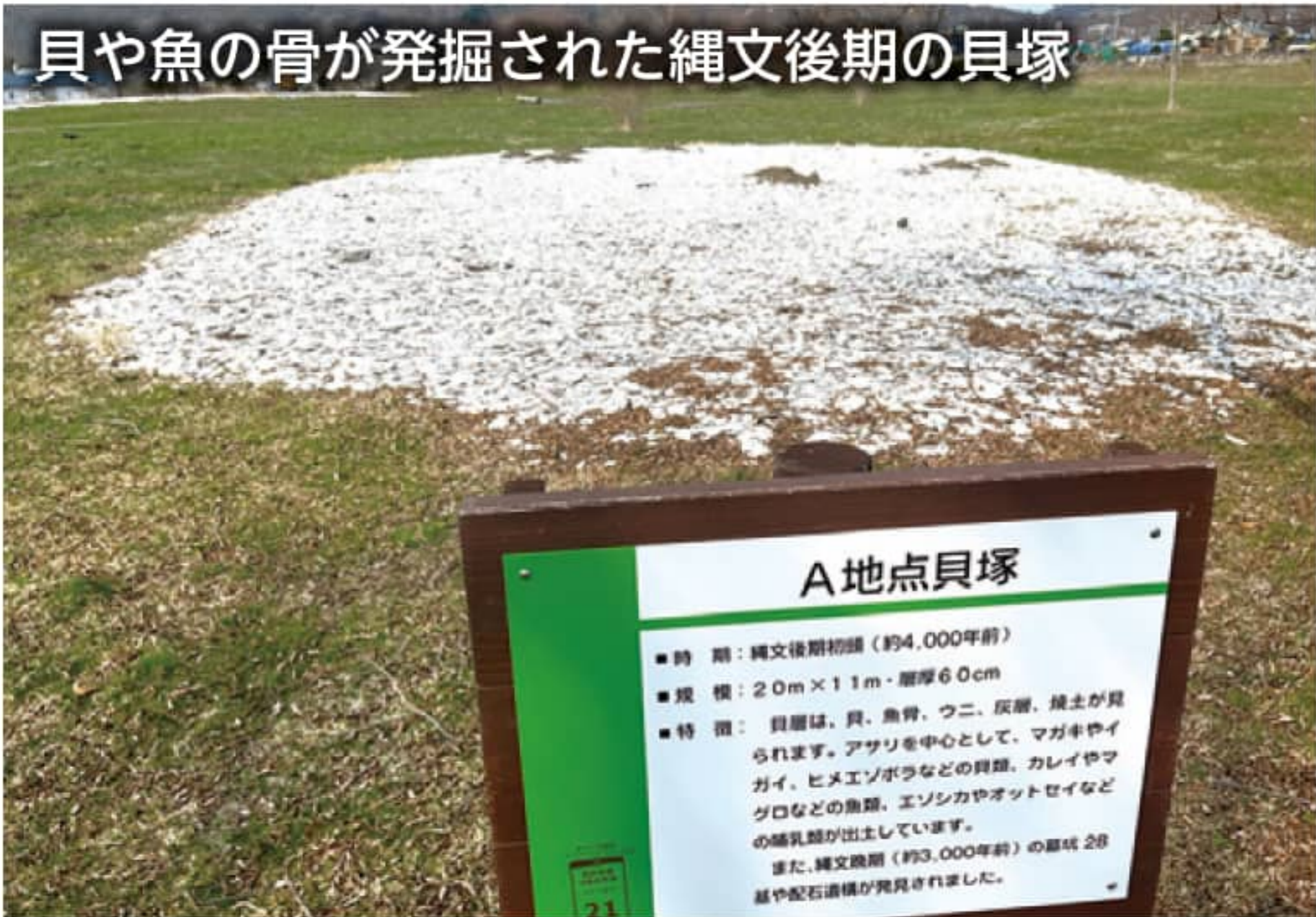
貝や魚の骨が発掘された縄文後期の貝塚

る。縄文時代晩期(約2800年前)のお墓28基の墓杭が検出。副葬品も伴っており、貝塚を伴った同墓地は、本道沿岸地域の生活と、高い精神性を示す貴重な遺跡とされている。