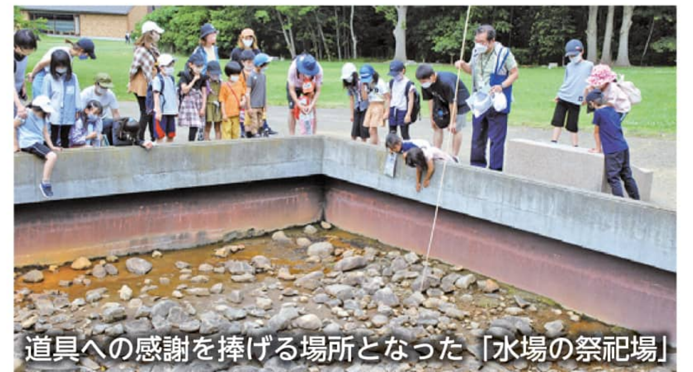
道具への感謝を捧げる場所となった「水場の祭祀場」

北黄金貝塚での生活や祭祀・儀礼の様子を伝える土器、石器などを展示し、中にはホタテやホッキ、マガキ、ハマグリなどの貝殻、シカやトドの骨や角など約30種類の出土品に直接触れるコーナーもある。屋内外の解説板には動画サイトにアクセスする二次元コードを掲示。解説動画を見ながらの見学が可能。