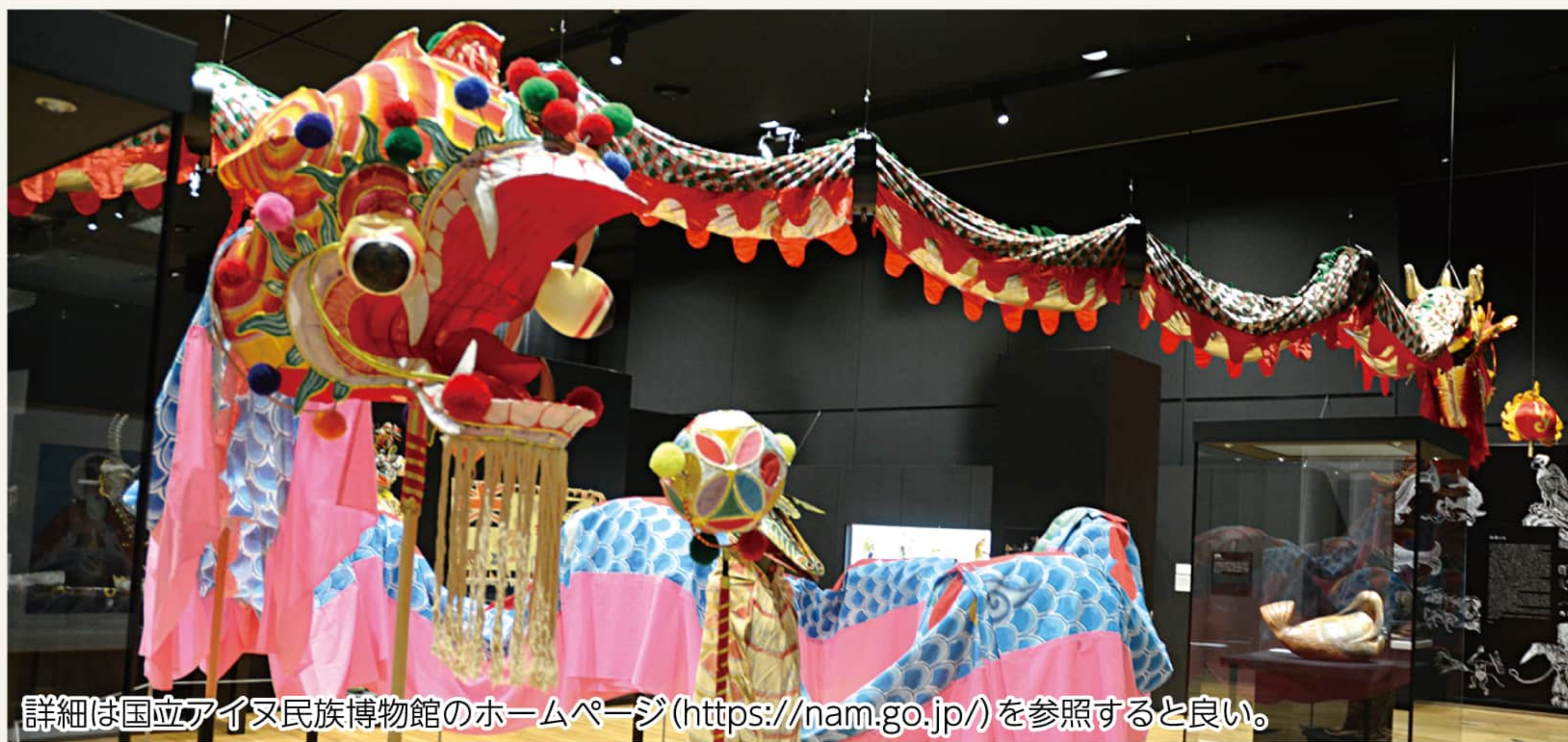
詳細は国立アイヌ民族博物館のホームページ( https://nam.go.jp/ )を参照すると良い。

サーロインやモモなどを握りにした「白老牛ステーキ寿司」はぜひ味わってほしい自慢の一品。サーロインとモモ各1貫(計2貫)で990円、各2貫(計4貫)1815円、サーロイン・モモ・カルビ各1貫の三種を1650円で提供。白老牛の美味しさを堪能できる人気のメニューだ。