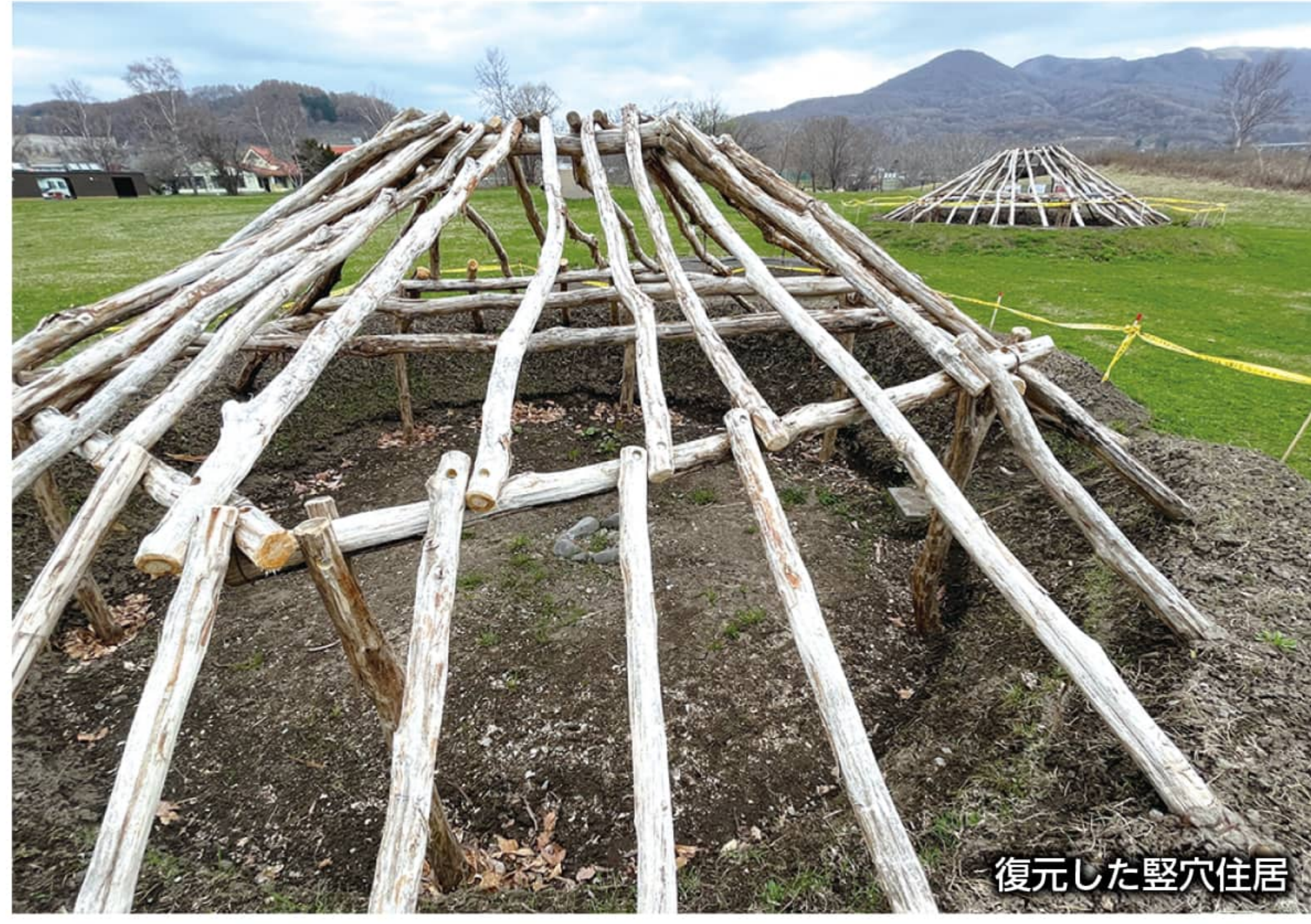
復元した竪穴住居

入江貝塚 標高約20mの台地にある遺跡。縄文時代前期から後期(約5千〜4千年前)に作られた。貝塚からはアサリなどの貝類のほか、ニシンやイルカなどの骨、釣り針やモリなど漁労用の骨角器が多く出土し、漁労が中心の生活だったことが分かる。また15体分の人骨が発見されており、貝塚が埋葬の場であったことが明らかに。竪穴建物跡は27軒確認されている。「住居の広場」では、遺構・骨格・土葺きの3つをテーマに住居が再現されている。