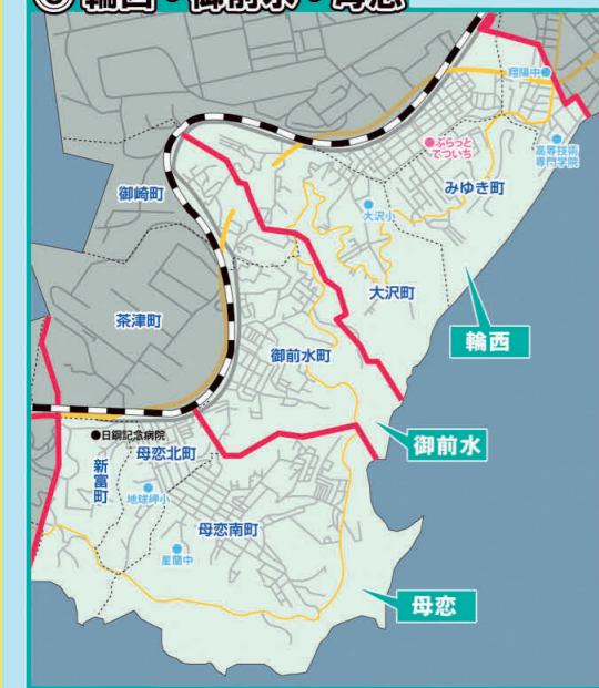
④ 輪西・御前水・母恋