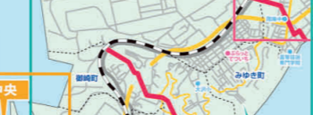
⑦ 輪西・御前水・母恋